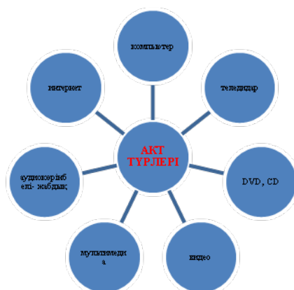
7.2 – сурет. АКТ түрлері

Барлық педагогтар мектепке дейінгі мекемелерді балаларды дамыту және оқыту кезінде ақпараттық-коммуникативтік технологияларды дұрыс қолдануды біле бермейді. Бұл мәселенің бар қиындығы мен көпқырлылығын түсіне отыра, біз балалардың жастық және психологиялық ерекшеліктерін, сондай-ақ гигиеналық нормаларын ескере отыра әзірленген әдістемелік нұсқауларды ұстану кезінде мектеп жасына дейінгі жастағы балаларымен өтетін сабақтарда компьютерлік техниканың қолданылуы баланы заманауи ақпараттық қоғам өміріне дайындауға көмектесетіндігін болжай аламыз. Түсіндірудің және бекітудің жаңа үйреншікті емес әдістерін қолдану, оған қоса ойын түрінде қолдану, балалардың ықтиярсыз зейінін жоғарылатады, еркін зейіні мен танымдық қызығушылығын дамытуға көмектеседі. Компьютердің мүмкіндігі ұсынылатын материал көлемін ұлғайтуға көмектеседі.