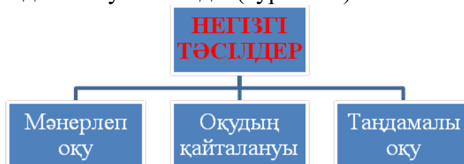
7.1 – сурет. Шығармалардың қабылдануын қалыптастыру тәсілдері

көрсетілуі арасындағы анық байланысқа (үстел үстіндегі театрда бейнелердің немесе ойыншықтардың орналасуы, диафильм кадрларын алмастыру және т.б.) жете отыра, алдын ала жаттығуы қажет. Меңгерілгенді бекіту үшін таныс шығармалар материалындағы дидактикалық ойындар (орта топтан бастап өткізеді), әдебиет викториналары (қорытынды тоқсандық сабақ немес кешкі ойын-сауық ретінде өткізеді) сияқты әдістер өте пайдалы. Дидактикалық ойындардың мысалы ретінде «Біреуі бастайды – екіншісі жалғастырады», «Менің ертегімді ойлап тапшы», «Мен қайдан боламын» және т.б. ойындары болуы мүмкін, көрнекілік материалды пайдалана отыра немесе сөздік нысанда өткізуге болады (сурет 7.1).